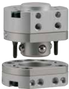
KHBC オートツール チェンジャー