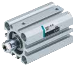
SSD2-HP1 スーパーコンパクトシリンダ