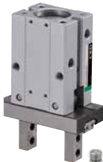
LSH-HP1 高耐久機器HPシリーズ リニアスライドハンド