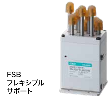
FSB フレキシブル サポート

2025年度 省エネ大賞 (製品・ビジネスモデル部門) 主理：一般財団法人省エネセンター