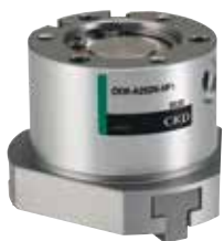
CKW-HP1 高耐久機器 HPシリーズ 3方爪チャック