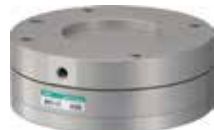
QRECシリーズ クイックアジャスタ slim