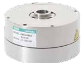
AX6R アブソデックス小型タイプ