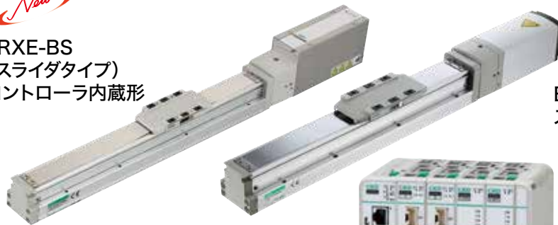
LRXE-BS (スライダタイプ) コントローラ内蔵形