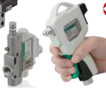
BNP パルスブロー バルブ