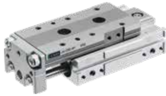
LCG-HP1 リニアスライドシリンダ