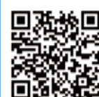
小形流量センサラピフロー(R) FSM3