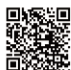
カルマン渦式水用流量センサフルーレックス WFK2