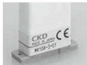
● アクチュエータ形